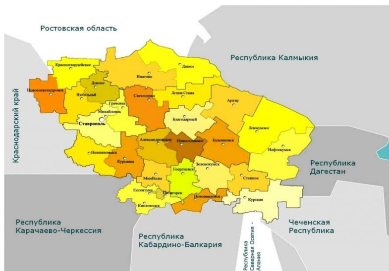
Рис. Административная карта Ставропольского края

Площадь территории края составляет 66,2 тыс. кв. км (0,4% территории Российской Федерации). Протяженность границ с соседними субъектами Российской Федерации – 1753,5 км. Расстояние от краевого административного центра города Ставрополя до Москвы – 1229 км., 87,8 % территории края занимают сельхозугодия, 1,7 % – леса, воды – 1,8 %, прочие земли – 8,7 %.